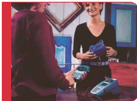
Plate-forme MagIC Evolution