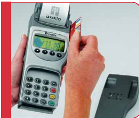
Plate-forme MagIC Evolution