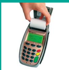
Imprimante rapide à chargement facile