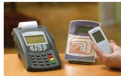
TeliumPass* et téléphone NFC

Pour les cartes sans contact et les téléphones NFC