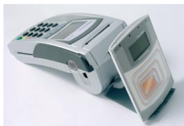
TeliumPass* et EFT30

Telium Pass : une gamme Telium Pass+ embarque les applications EMV et piste magnétique des cartes sans contact certifiées par les émetteurs internationaux. Telium Pass s'adresse aux applications de paiement. Quant à Telium Pass (One) il autorise les autres types d'application.