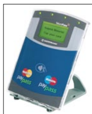
Maestro PayPass et MasterCard PayPass

Paiement par carte sans contact. Paiement par téléphone mobile (NFC). Le paiement sans contact est en passe de rentrer dans notre vie quotidienne. Simple, rapide, efficace, il sait convaincre les porteurs, les commerçants et les établissements financiers. Les cibles Telium Pass sauront accepter ces nouveaux modes de paiement en toute simplicité. Elles sont de plus ouvertes à tout autre type d'application sans contact.